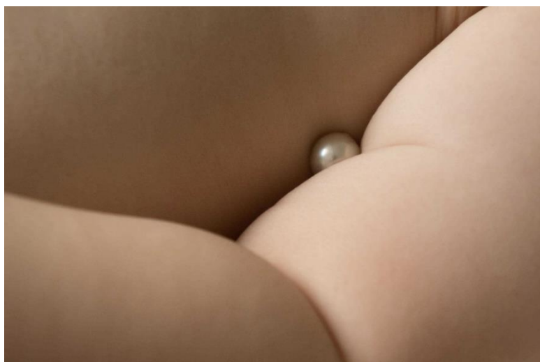
河野愛《こともの foreign object》2021年