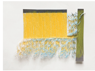
藤岡祐機《無題》2006頃 滋賀県立美術館蔵

滋賀県立美術館のコレクションを中心に、約70点の作品を展示。 —心と身体、ぜんぶで楽しむ展覧会！