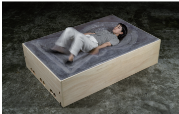
岡本高幸《とろける身体—古墳をひっくり返す》2021 個人蔵