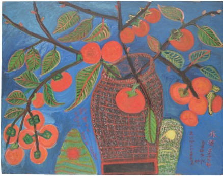
塔本シスコ《永源寺の柿》2001 滋賀県立美術館蔵