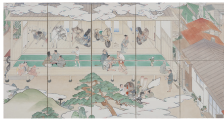
山口晃《展覧2004》2004 滋賀県立美術館 ©YAMAGUCHI Akira, Courtesy of Mizuma Art Gallery