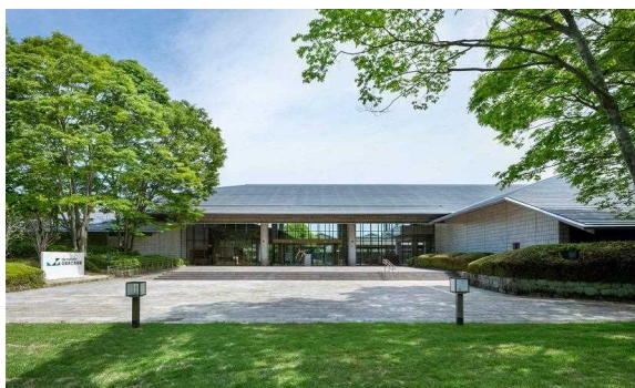
滋賀県立美術館外観