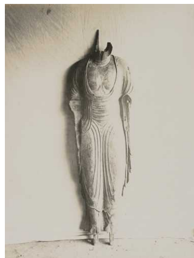
小川 一眞《唐招堤寺 破損仏・鼓楼》 1888年 東京都写真美術館蔵