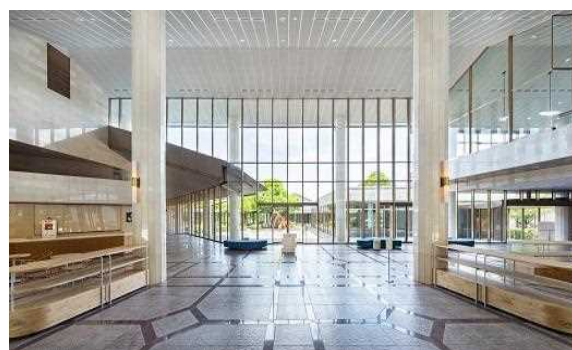
滋賀県立美術館エントランスロビー