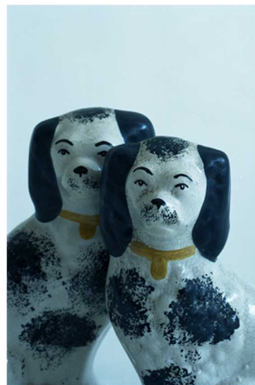
撮影：ホンマタカシ 『物物』2012 年刊行 猪熊コレクションより

本章では、モノをめぐるグラフィックデザインとして、日本における初期の広告写真から、ポスターなどの広告にみられるグラフィック表現を紹介します。また、ホンマタカシが猪熊弦一郎のアンティークコレクションを撮影した『物物』のプロジェクトを展示します。写真家による多種多様な「物撮り」のイメージをお楽しみください。