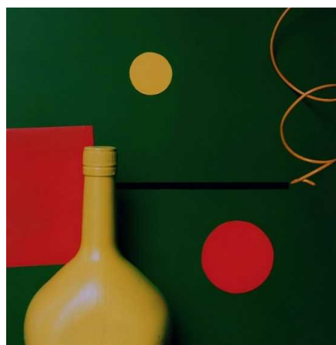
山沢 栄子《What I Am Doing No.77》 1986 年 東京都写真美術館蔵