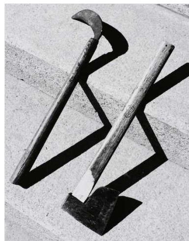
安井 仲治《斧と鎌》1931 年 東京都写真美術館蔵