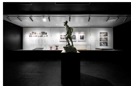
秩父宮記念ギャラリー(国立競技場内)